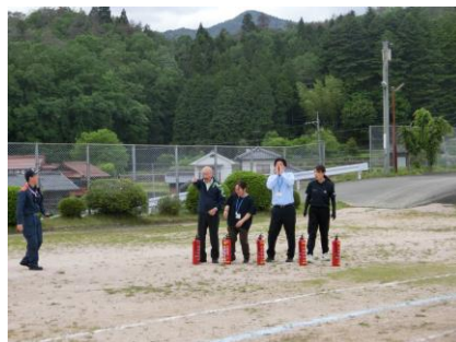
先生たちも消火訓練