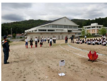
生徒による消火訓練

当日は消防署から4名の方にお越しいただき、消火訓練や万が一の事態における行動についてアドバイスをいただきました。7月には職場体験でもお世話になります。引き続きよろしくお願いいたします。