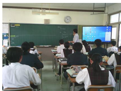
先生の説明 (確かに習った!)

授業の中盤では、班の仲間と解き方について意見を交流。最後は自分の考えをプリントに書いたり、Chromebook を使って提出したりしました。