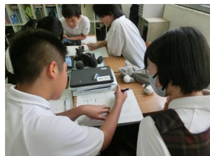
班の交流 (なるほど!!!!)