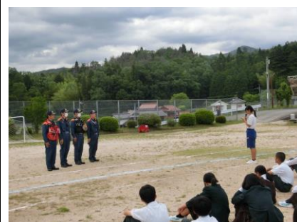
生徒代表お礼の言葉